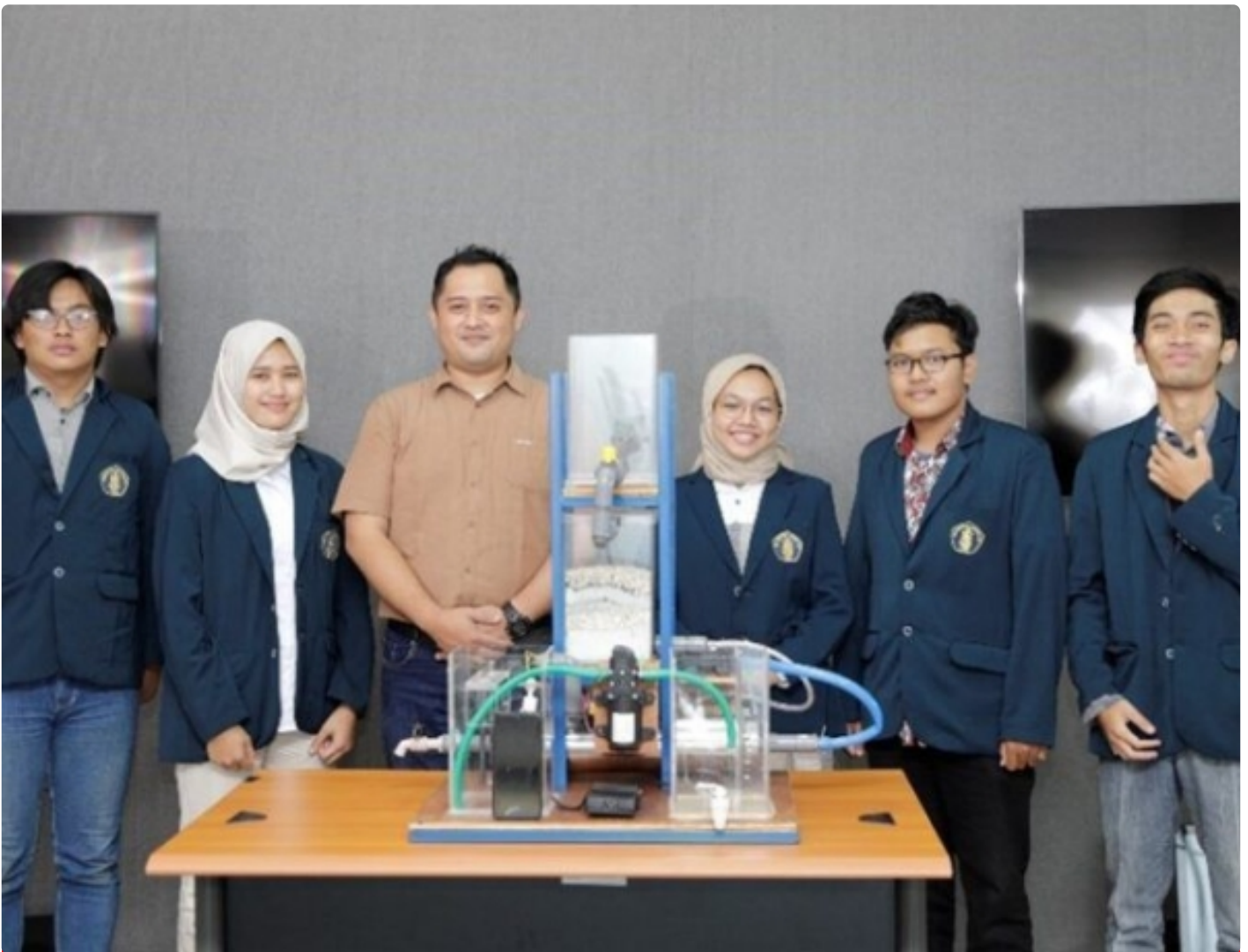
5 Mahasiswa UB ciptakan alat pemanen air hujan siap minum